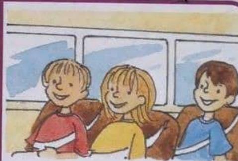
an turas scoile